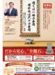
▲全優石・販促ツール