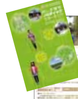
▲三島市ノルディックウォーキング冊子