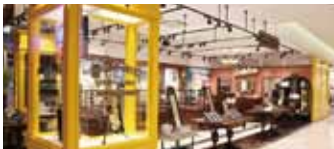
▲サントムーン柿田川・ファッションゾーン リニューアル工事