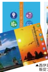
▲西伊豆町ふるさと納税関連販促ツール