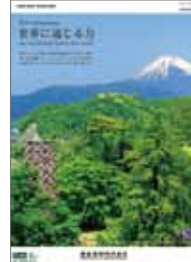
▲東芝機械カレンダー