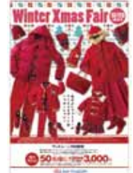
▲サントムーン柿田川・販促ツール