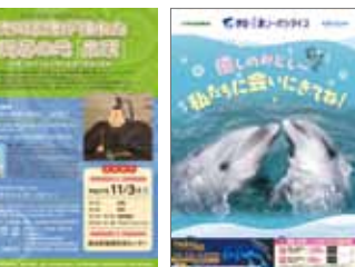
▲伊豆・三津シーパラダイス販促ツール