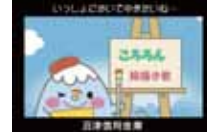
▲サントムーンビジョン(沼津信用金庫)