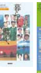
▲清水町「歴史文化フォーラム」チラシ