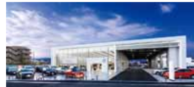
▲フォルクスワーゲン静岡駿東・オープニング