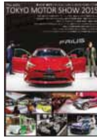
▲ネットヨタ静岡・販促ツール