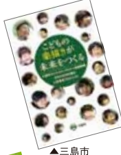
▲三島市クリエイティブシティ事業