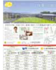
▲虎ノ門病院「菜の花の丘」竣工広告